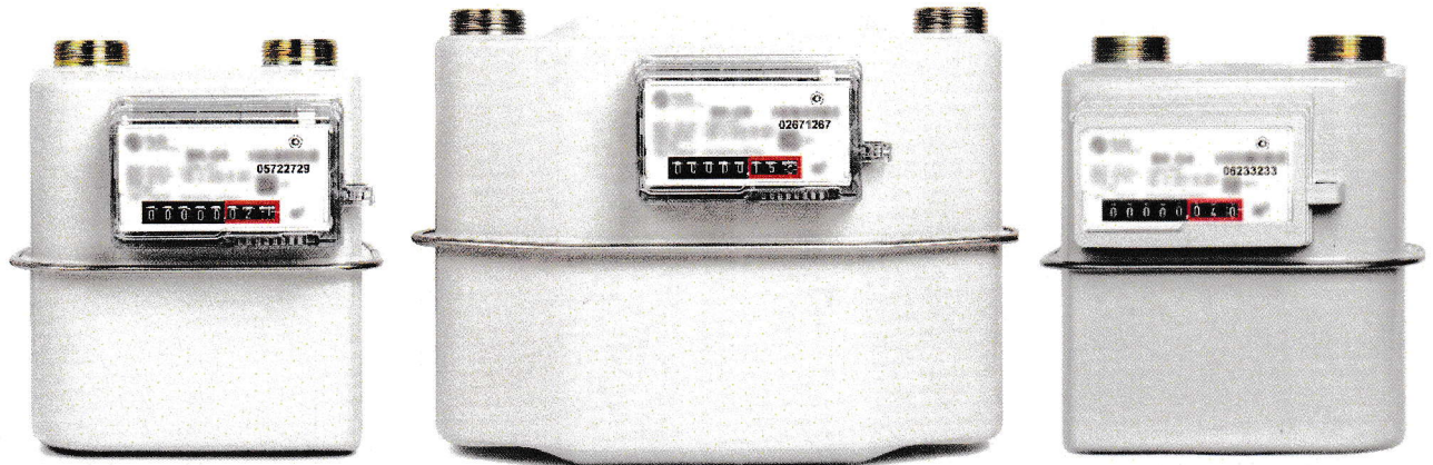
а) исполнение с прозрачным корпусом отсчетного механизма